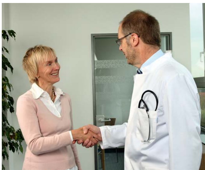
Ein leistungsstarker Zusatzschutz garantiert auch gesetzlich Krankenversicherten optimale Betreuung im Krankenhaus.

vorgenommen werden, trägt auch die SIGNAL IDUNA Rechnung. So leisten die TOP-Tarife auch dann, und zwar zu 100 Prozent nach Vorleistung der Kasse, wenn der Versicherte im Krankenhaus eine ambulante Operation wünscht. Dies ist bei ambulanten Operationen möglich, die eine stationäre Behandlung ersetzen (im gemäß § 115 b Sozialgesetzbuch V erstellten Katalog unter Kategorie 2 aufgeführte Operationen), wenn also zum Bei-